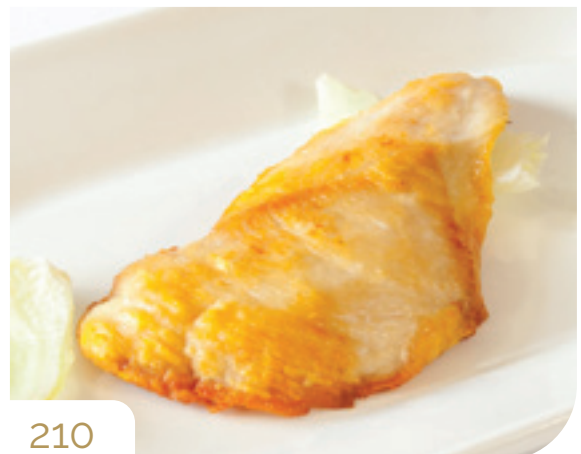
Salmone alla griglia ● Allergeni: 4,6,11