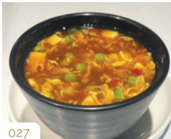
Zuppa di miso Tofu e alghe